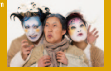
企画協力: Asia Now

原作:W.シェイクスピア / 演出:ヤン・ジョンウン 9月28日(金) 19:00-29日(土) 19:00 ※9月29日(土)終演後にアフタートークを行います 料金:大人2,500円 / 中学生500円 / 小学生無料 韓国の劇団として世界的に今最も評価の高いカンパニーの代表作を野外劇場で上演。夏の森の中で展開する恋のドタバタを、韓国伝統の歌とダンスで華やかに彩ります。理屈抜きに楽しめる躍動感あふれるステージをお楽しみください。