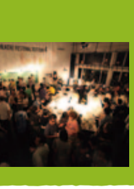
鳥の劇場【スタジオ】