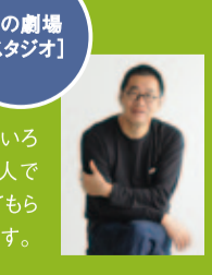
鳥の劇場【スタジオ】

9月29日(土) 13:00~14:30 料金:無料 デザイナーの梅原真さんは、いいモノ、いい場所、いい人、いろいろな「いい」を見だし、その価値を多くの人に伝えることの名手です。その梅原さんに、鳥取市鹿野町と鳥の演劇祭に出会ってほしい、これからの「ここ」の発展をいっしょに夢話し語り合う企画です。