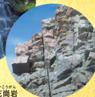
うらどめかいがん かこうがん 浦富海岸の花崗岩